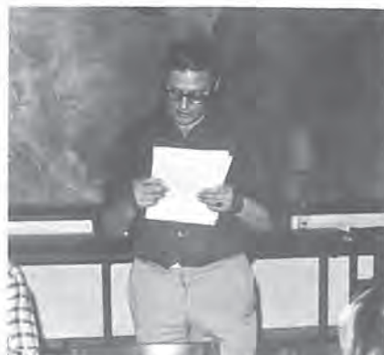
Der Organisator des Schibli-Velorennens, Herr Schach, beim verkünden der Rangliste.