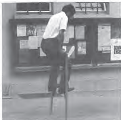
Me trainiert, um sich auf der Baustelle EKZ-Globus über Wasser halten zu können!!!