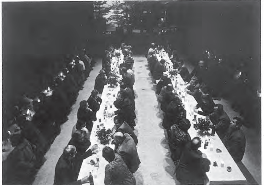
Der ansprechend geschmückte Festsaal