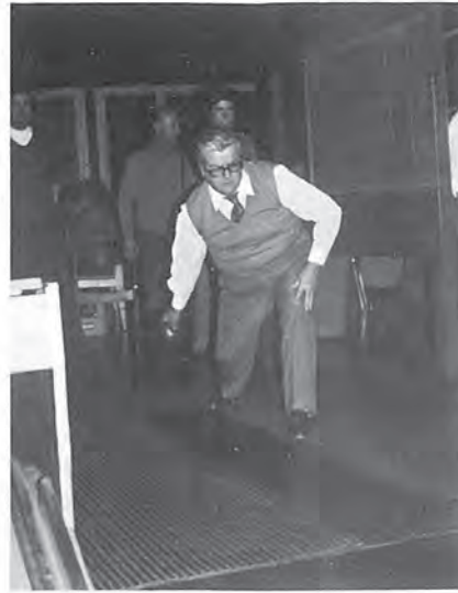
Fitness-Training für die beiden Chefs