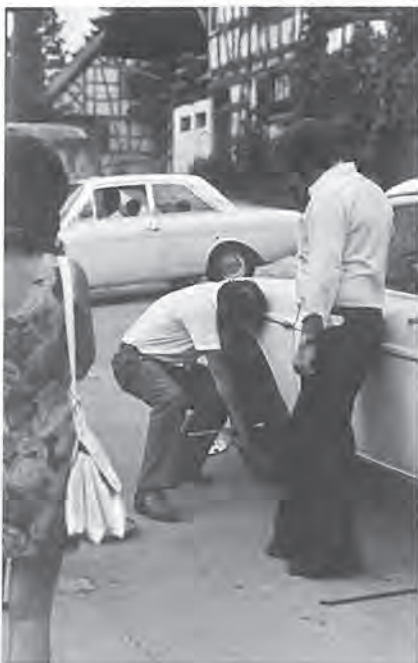
Es wurde hart gearbeitet....

Im «Schiblianer» vom November 1973 haben wir über das Schibli-Ralley berichtet. Dazu hier einige Betrachtungen und Studien von Bu: