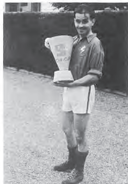
Der Gewinn des Schi-Cups blieb für uns ein Wunschträumli!

1954 fand dann der erhoffte Ausgleich gegen denselben Gegner statt. Aber oh jeh, wir verloren 1:10.