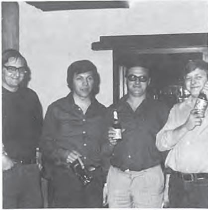
Postenchefs und Besenwagenfahrer nach beendeter Arbeit.