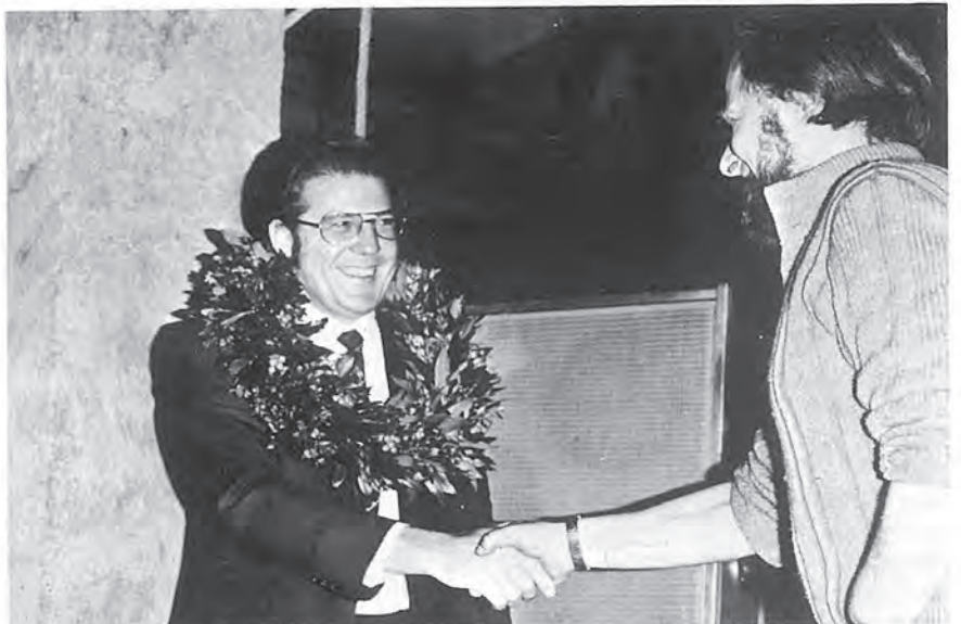
Beim Bart des Propheten Lanners. Hier gilt der Prophet etwas in seinem Lande