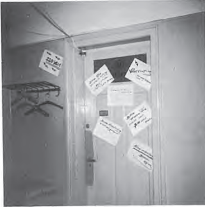
Hier gehts zum Büro des Gefeierten