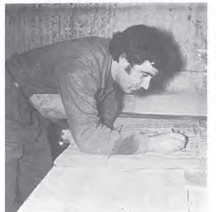
Einer, der Plan-Korrekturen nicht vergisst ...

Kunden sind auch heute noch die beste Propaganda. Ein nicht unbedeutender Teil der Kleinarbeiten erstreckt sich auf Telefon-Anlagen; dabei werden jährlich über 300 Installationsanzeigen erstellt, vom Auswechseln der Anschlusschnur bis zur Automatenanlage.