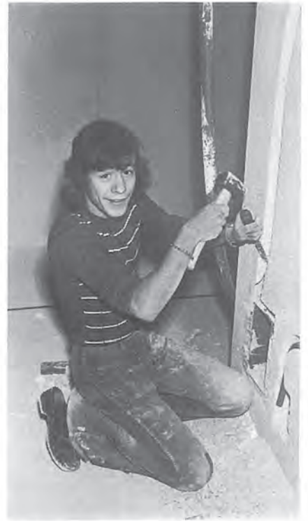
Stift Heinz am Werken ...

Besonderes Augenmerk legen wir auf die Servicearbeiten, die ungefähr 1/5 des Jahresumsatzes ausmachen. Oft werden Kleinaufträge als wenig lukrative Anhängsel betrachtet. Zugegeben, die administrativen Arbeiten liegen in diesem Sektor verhältnismässig hoch, doch sind sie es vielfach, die zu grösseren Aufträgen hinführen. Zufriedene