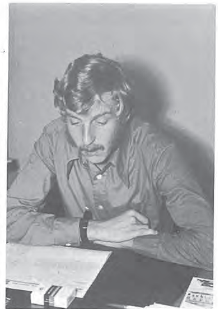
«Mädchen für Alles» Die Stimme am Telefon: M. Herzog