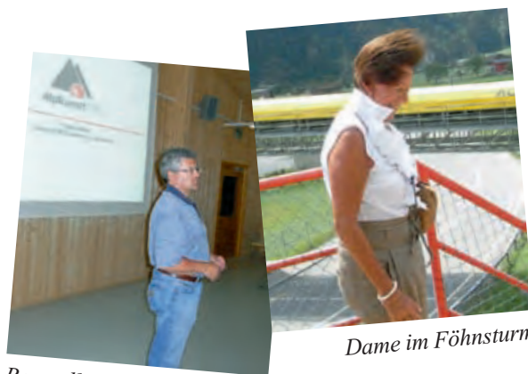
Dame im Föhnsturm