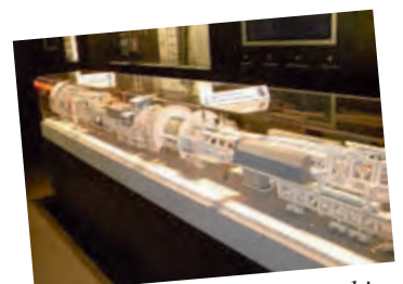
Modell der Tunnelbohrmaschine