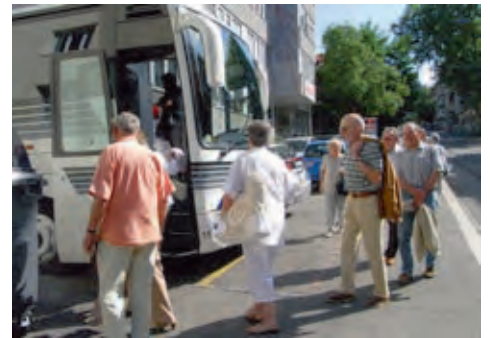
Wir entern den Car

Dieses Jahr führte uns der Carchauffeur nach Flüelen zur Begutachtung der neuen Räumlichkeiten unserer dortigen Tochterfirma und zum Mittagessen in die Hostellerie «Sternen». Anschliessend liessen wir uns gleichermassen von der gewaltigen Baustelle am Nordportal des Gotthard-Basistunnels wie vom Föhnsturm im Urnerland beeindrucken. Dank der neu eröffneten A4 waren wir zu früh in Zürich zurück, was uns einen nicht vorgesehenen Halt am Stadthausquai mit Blick auf die Altstadt, das Grossmünster und blütelnde Frauen in der Frauenbadi ermöglichte. In der Zwischenzeit hatten fleissige Damen unser Festlokal im «Top of the Schibli Tower» so weit hergerichtet, dass wir uns zum ausgiebigen Nachtessen nochmals zusammensetzen konnten.