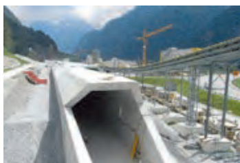
AlpTransit Gotthard Baustelle Erstfeld