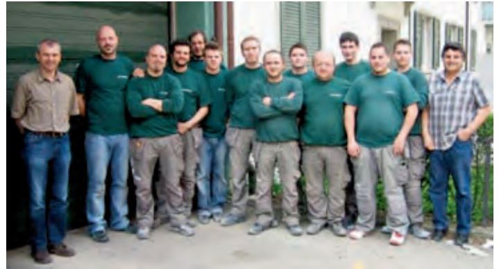
Mitarbeiter der Otto Ramseier AG in Zürich

Mitarbeiter: 24 Lehrlinge: 7 Umsatz 2010: 4,5 Millionen