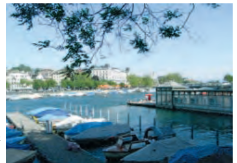
Zurück im föhnigen Zürich