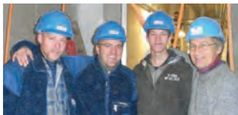
Stark im Team