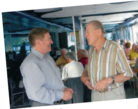
Zwei alte Kämpfer

(schi) Im Laufe der Jahre ist das traditionelle Treffen vom einfachen Nachmittagsausflug zum Ganztagesprogramm mutiert. Gleichzeitig wuchs auch der Heeresbestand der Pensioniertentruppe ständig an und damit auch der nötige Budgetposten. Aber die hervorragenden Leistungen der heute aktiven jungen Generation lässt uns Alten den Tag mit dem gemeinsamen Ausflug ohne schlechtes Gewissen geniessen.