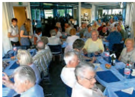
In Erwartung, dass es «endlich wieder einmal» etwas zu essen gibt

Dieses Jahr führte uns der Carchauffeur nach Flüelen zur Begutachtung der neuen Räumlichkeiten unserer dortigen Tochterfirma und zum Mittagessen in die Hostellerie «Sternen». Anschliessend liessen wir uns gleichermassen von der gewaltigen Baustelle am Nordportal des Gotthard-Basistunnels wie vom Föhnsturm im Urnerland beeindrucken. Dank der neu eröffneten A4 waren wir zu früh in Zürich zurück, was uns einen nicht vorgesehenen Halt am Stadthausquai mit Blick auf die Altstadt, das Grossmünster und blütelnde Frauen in der Frauenbadi ermöglichte. In der Zwischenzeit hatten fleissige Damen unser Festlokal im «Top of the Schibli Tower» so weit hergerichtet, dass wir uns zum ausgiebigen Nachtessen nochmals zusammensetzen konnten.