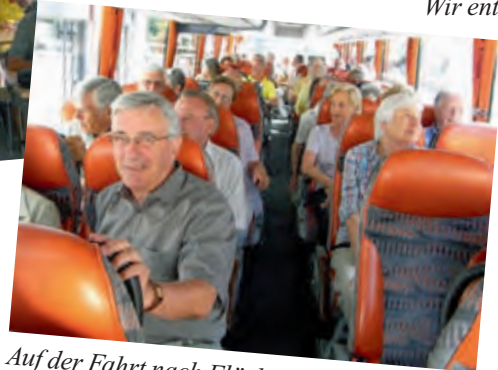
Auf der Fahrt nach Flüelen