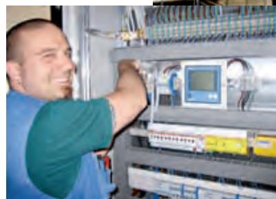
Der freundliche Stromer auch bei der Otto Ramseier AG