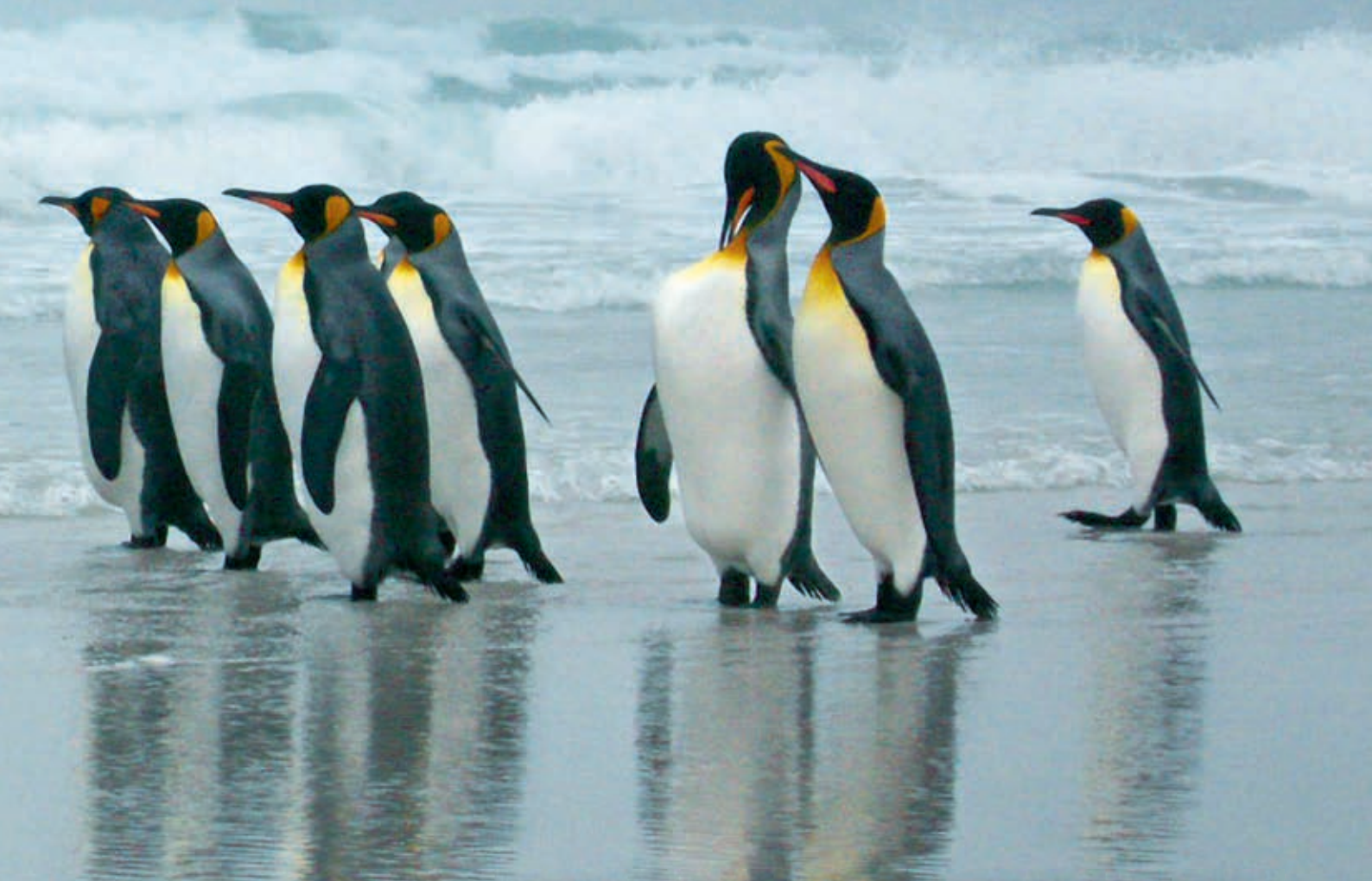
Königspinguine in der Antarktis; grosse Foto Hans Jörg Schibli, kleine Foto Betina Hüß